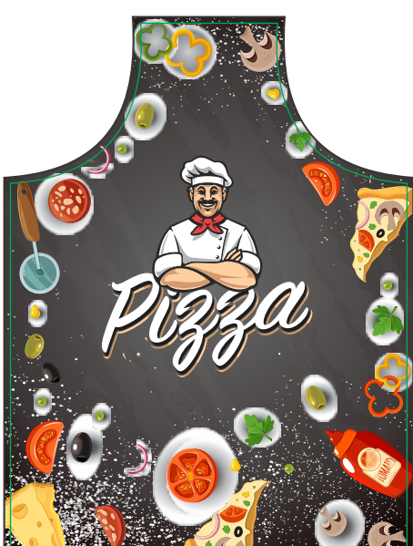
Pagina 01 Impressão

Veja abaixo como montar a sua arte para envio do seu arquivo